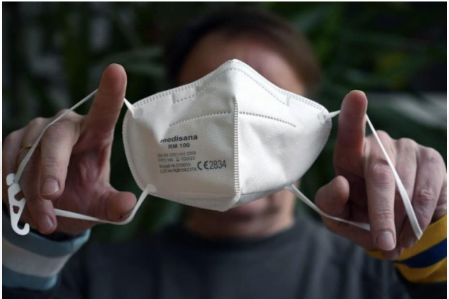
Eine FFP2-Maske. (Archiv)

20.01.2021, 07:12 Uhr Das riecht nach einem kleinen Fünkchen Hoffnung! Nachdem Bund und Länder die Verlängerung des Lockdowns verkündet haben, meldete das Robert-Koch-Institut (RKI) am Dienstagabend leichte Entspannung beim Infektionsgeschehen. Im seinem Lagebericht schrieb das RKI: „Nach einem starken Anstieg der Fallzahlen Anfang Dezember, einem Rückgang während der Feiertage und einem erneuten Anstieg in der ersten Januarwoche sinken die Fallzahlen in den meisten Bundesländern (jedoch nicht allen) nun leicht.“ Dennoch meldete das Institut immer noch hohe Zahlen: 15 974 Corona-Neuinfektionen und 1148 neue Todesfälle wurden innerhalb von 24 Stunden verzeichnet, wie das RKI am Mittwochmorgen bekanntgab. Vor genau einer Woche hatte das RKI 19 600 Neuinfektionen und 1060 neue Todesfälle binnen 24 Stunden verzeichnet.